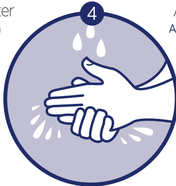
Rinse both sides of hands with water

Enjuague ambos lados de las manos con agua