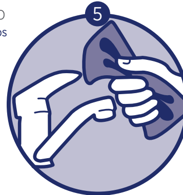
Dry hands and shut off faucet with hand towel

Enjuague ambos lados de las manos con agua