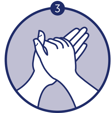
Lather and wash for 15 - 20 seconds Refriegue y lave al menos 15 a 20 segundos