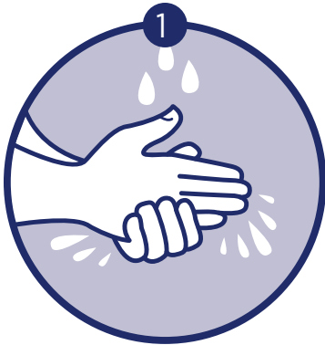
Wet hands with water Moje las manos con agua