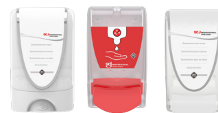
IFSTF2STH SANILDS IFSILDSSTH