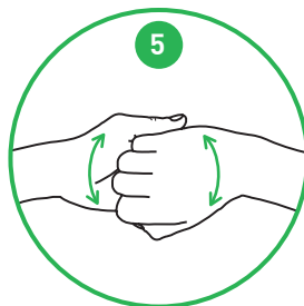
Omkring fingrene og neglene