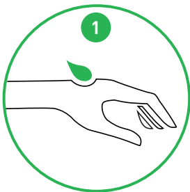
Påfør cremen på håndryggen

- PÅFØRES RENE OG TØRRE HÆNDER EFTER ARBEJDETS OPHØR. BRUGES EFTER HÅNDVASK ELLER VED TØRRE HÆNDER.